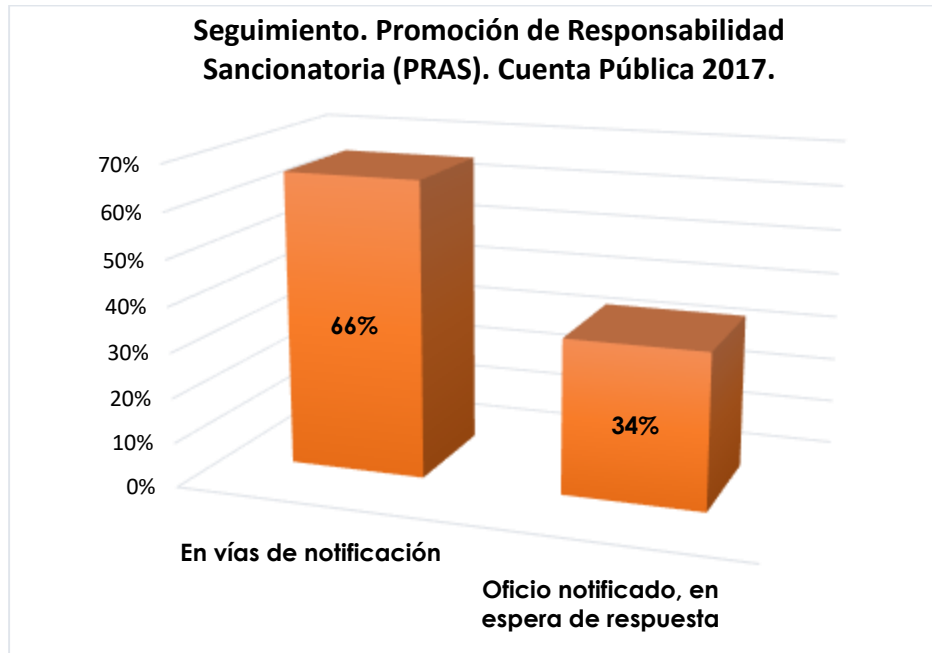
Gráfico 3.- Distribución porcentual referente al estatus de los resultados, Promoción de Responsabilidad Sancionatoria (PRAS), remitidos a la Coordinación de Investigación de la Auditoría Superior del Estado, respecto de la Cuenta Pública 2017. Auditoría Financiera y de Cumplimiento.

presente se encuentran debidamente notificados ante los Órganos Internos de Control, un 34% equivalente a 164 PRAS, así mismo se tiene que un total de 312 PRAS que corresponde a un 66% se encuentran en proceso de notificación, generándose de esta manera la siguiente representación gráfica del seguimiento de los Promoción de Responsabilidad Sancionatoria: