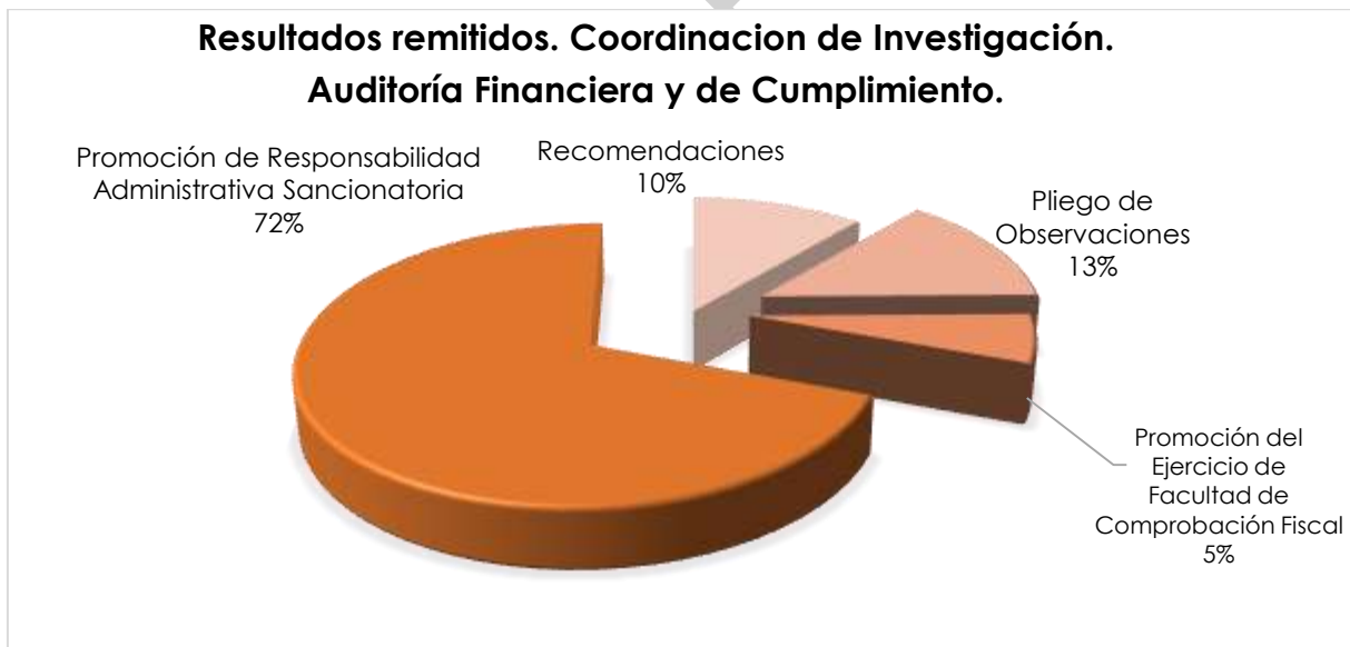
Gráfico 1.- Información Auditoría Financiera y de Cumplimiento de Acción y Porcentaje. Acciones remitidas a la Coordinación de Investigación de la Auditoría Superior del Estado.

De lo anterior se desprende que, de las 661 acciones remitidas a la Coordinación de Investigación, en el periodo comprendido del 01 de julio al 30 de septiembre del 2020 , corresponden en un 10% (69) a Recomendaciones, 13% (84) a Pliegos de Observaciones, 13% (32) a Promoción del Ejercicio de la Facultad de Comprobación Fiscal y un 72% (479) que corresponden a la Promoción de Responsabilidad Administrativa Sancionatoria.