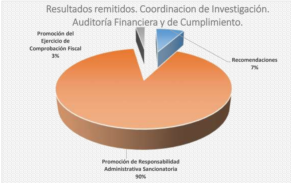
Gráfico 1.- Información Auditoría Financiera y de Cumplimiento de Acción y Porcentaje. Acciones remitidas a la Coordinación de Investigación de la Auditoría Superior del Estado.