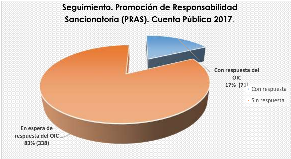
Gráfico 3.- Distribución porcentual referente al estatus de los resultados, Promoción de Responsabilidad Sancionatoria (PRAS), remitidos a la Coordinación de Investigación de la Auditoría Superior del Estado, respecto de la Cuenta Pública 2017. Auditoría Financiera y de Cumplimiento.