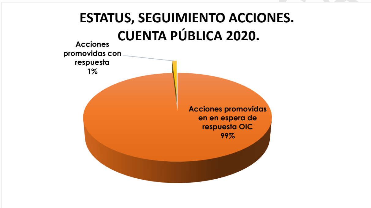
GRÁFICO 2. Representación gráfica del estatus de seguimiento de las acciones, relativas a la Cuenta Pública 2020.

2023 , mediante oficio número 008/2023, la instauración de procedimientos administrativos derivados de 2 Promociones de Responsabilidad Administrativa Sancionatoria (PRAS) , específicamente de los resultados 4 y 11 generados de la Fiscalización de la Cuenta Pública 2020.