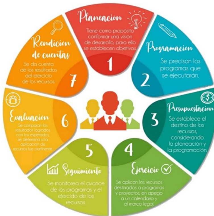
Gráfico 1. Ciclo presupuestario

Para la ejecución de esta auditoría se determinó aplicar procedimientos específicos relacionados con cada una de las siete etapas.