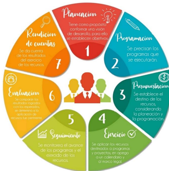
Gráfico 1. Ciclo presupuestario

Para la ejecución de esta auditoría se determinó aplicar procedimientos específicos relacionados con cada una de las siete etapas.