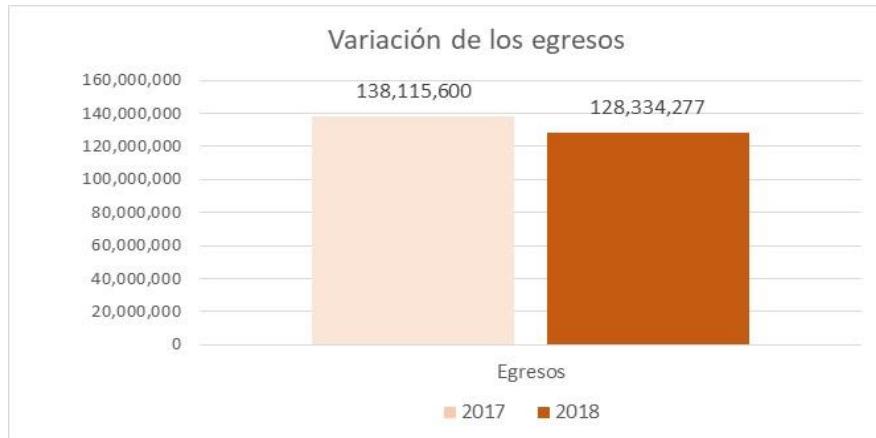
Gráfico 2. Variación de los egresos