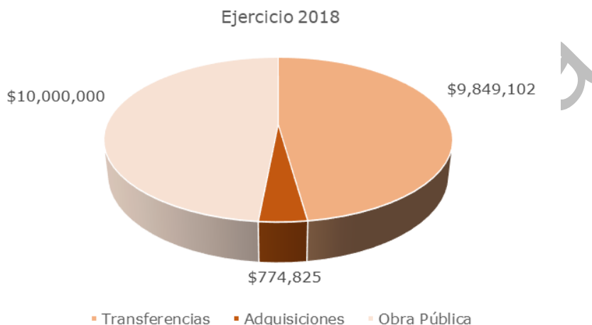
Gráfico 2. Partidas de egresos registradas en cuentas de inversión