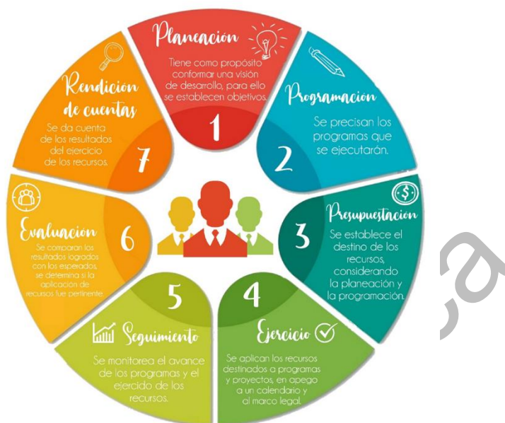
Grafico 1. Ciclo presupuestario